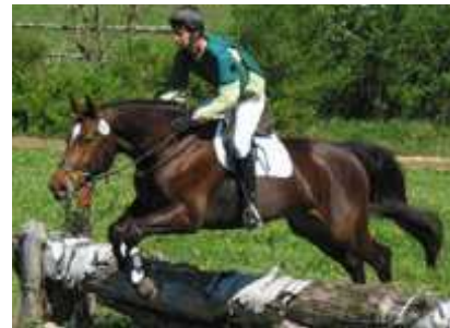
Dressur - Springen - Gelände